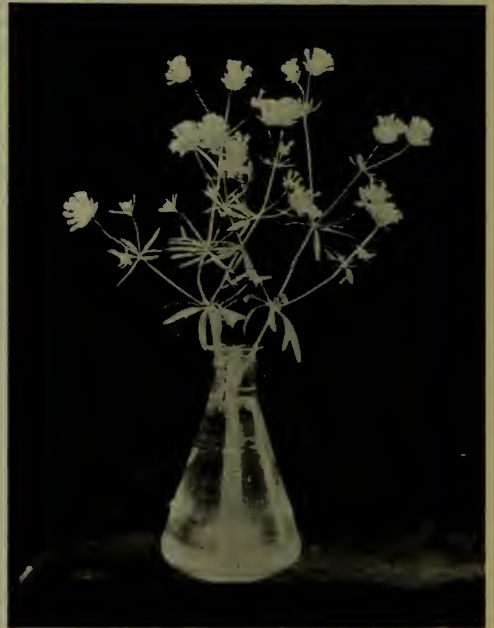
Aspérule azurée d'Orient.